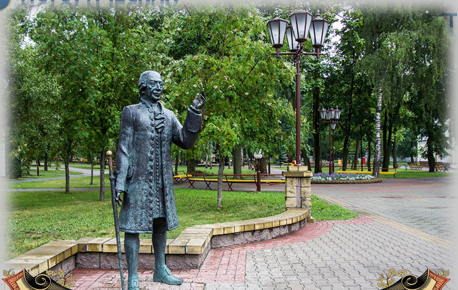
Жан Эммануэль Жилибер