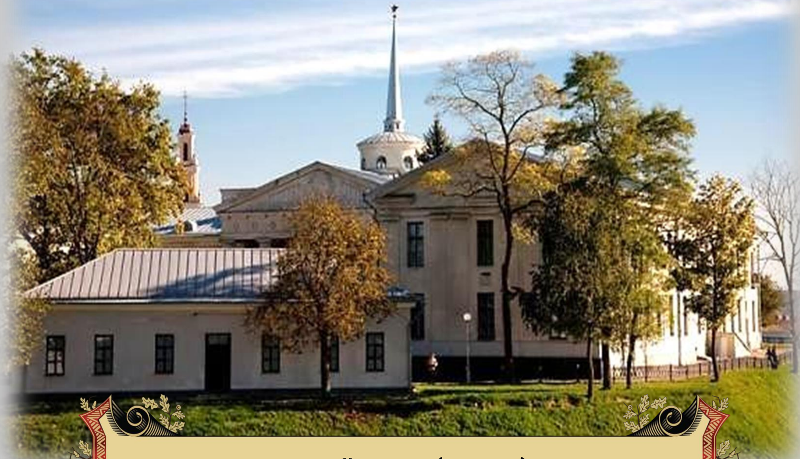
Новый замок (XVIII в.)