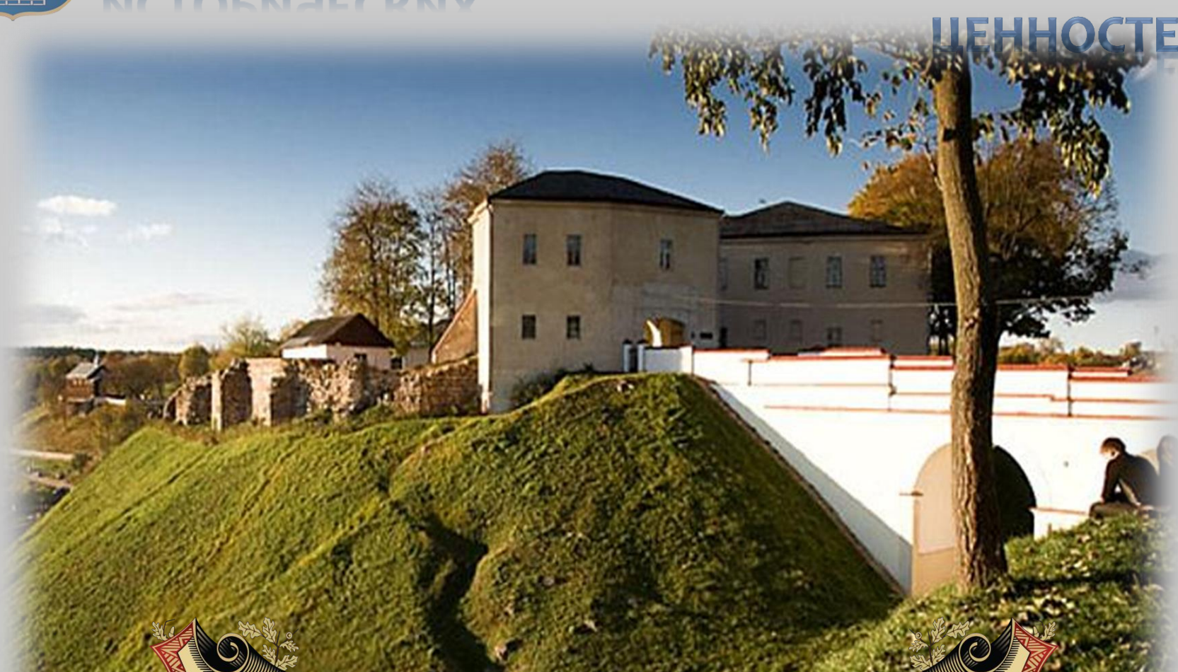
Старый замок (XIV в.)