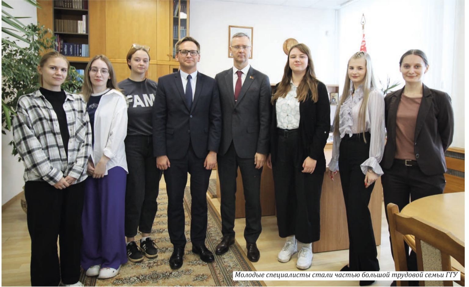
Молодые специалисты стали частью большой трудовой семьи ГГУ

РАСТИМ КАДРЫ | В вузе появилась новая специальность