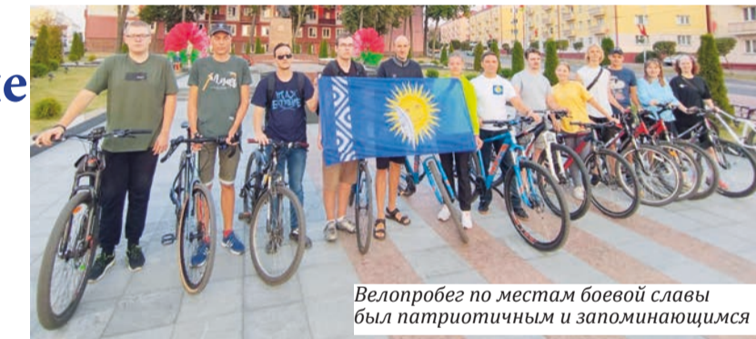
Велопробег по местам боевой славы был патриотичным и запоминающимся