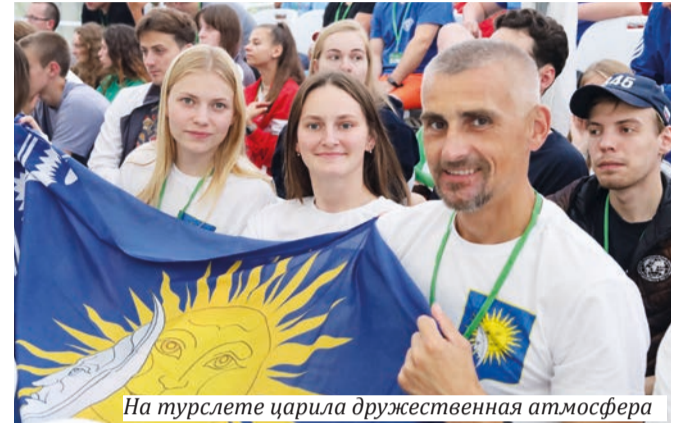
На турслете царил дружественная атмосфера

В Новгородской области Российской Федерации проходил студенческий туристский слет Союзного государства. В нем принимали участие 200 молодых людей из 14 белорусских и 33 российских вузов.