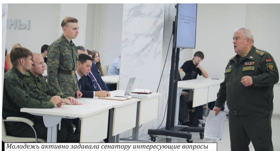
Молодежь активно задавала сенатору интересные вопросы