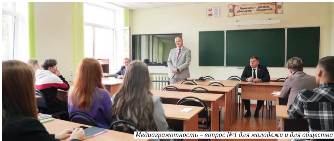
Медиаграмотность – вопрос №1 для молодежи и для общества

Представители СМИ и комитета идеологической работы и по делам молодежи облисполкома встретились с будущими журналистами, первокурсниками ГГУ имени Ф. Скорины.