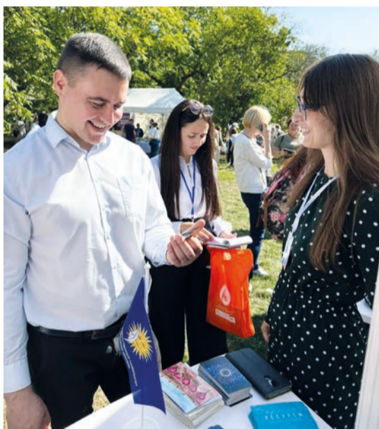
Площадка ГГУ вызвала искренний интерес у министра образования Андрея Иванца