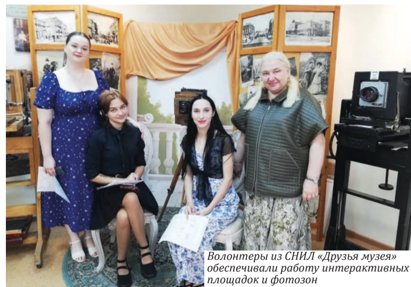
Волонтеры из СНИЛ «Друзья музея» обеспечивали работу интерактивных площадок и фотозон