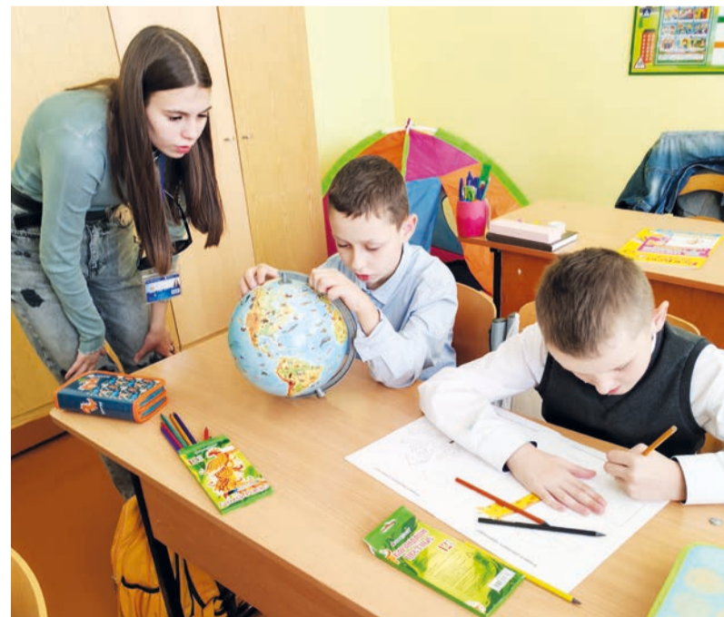
Волонтеры отряда «Планета Доброты» геолого-географического факультета собрали канцтовары для детей Улуковской спецшколы-интерната