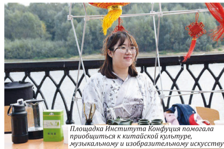
Площадка Института Конфуция помогла приобщиться к китайской культуре, музыкальному и изобразительному искусству