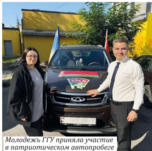
Молодежь ГГУ приняла участие в патриотическом автопробеге